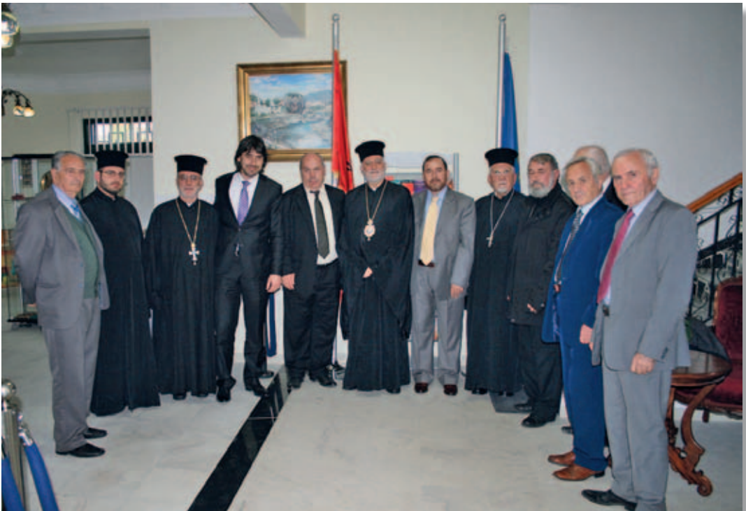
Tirana. Incontro con i rappresentanti dell'Istituto del Pensiero e della Civiltà Islamica.

Terminato il pranzo con i Capi di tutte le altre religioni in Albania, la nostra delegazione si è recata a far visita all'Istituto del Pensiero e della civiltà Islamica, diretta dal