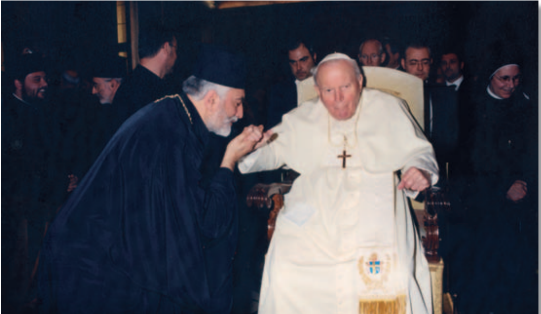
Roma, 11 gennaio 2005. Sala Clementina.