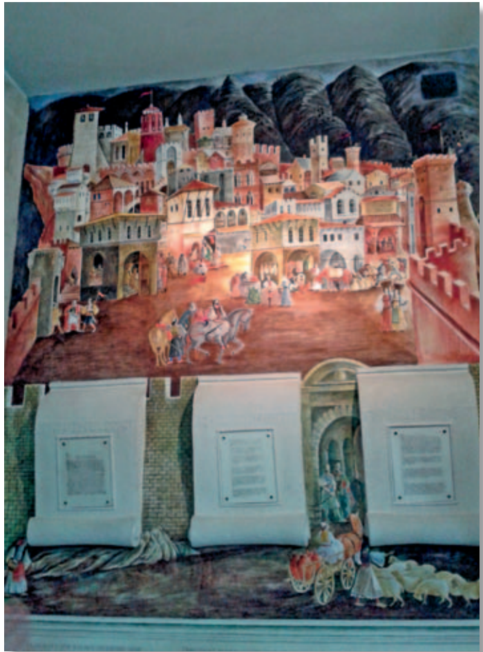
Visita al Monumento di Skanderbeg a Lezhë.

In ciò l’Eparchia di Lungro ritrova le ragioni della propria missione di isola ecclesiale bizantina, in Occidente, a testimonianza della bellezza della Chiesa Una, Santa, Cattolica, Apostolica, Vigna e Sposa del più bello tra tutti gli uomini, il Risorto, che ha riportato all’unità le cose divise.