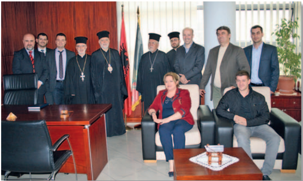
Incontro con i rappresentanti dell'Associazione "Pal Engjell"