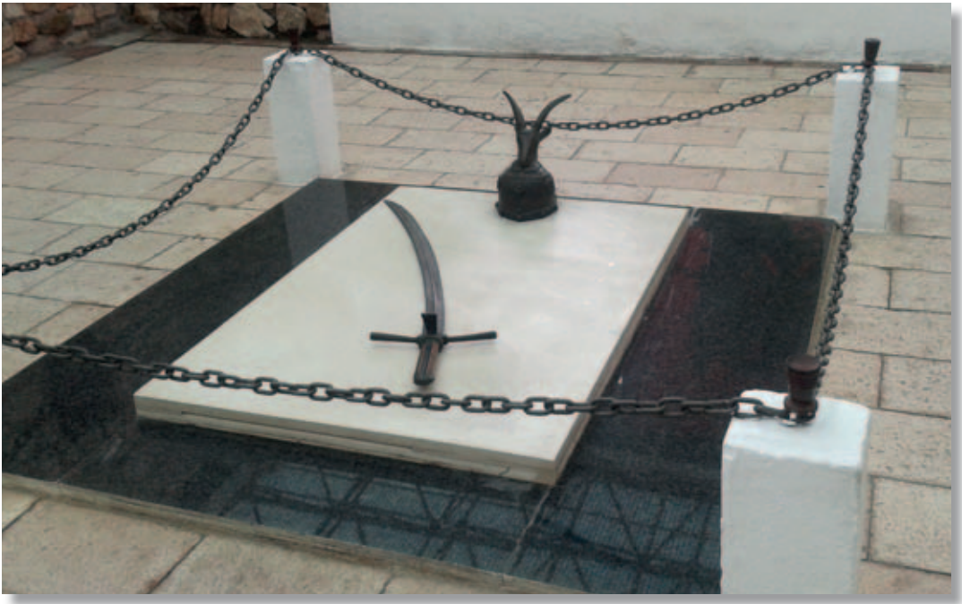
Visita al Monumento di Skanderbeg a Lezhë.

le sue gesta ed i suoi scritti. È un percorso culturale affascinante, dove il mito ha le sue radici profonde e le sue motivazioni storiche. Nell’annesso ristorante sono convenuti tutti i componenti dell’Associazione “Pal Engjell” con il Presidente Ilirjan Celibashi, Ministro per i rapporti con il Parlamento. Tra musiche, canti e balli epici si è creata un’atmosfera allegra e gioiosa, mentre fuori pioveva a dirotto. Ci sono stati scambi