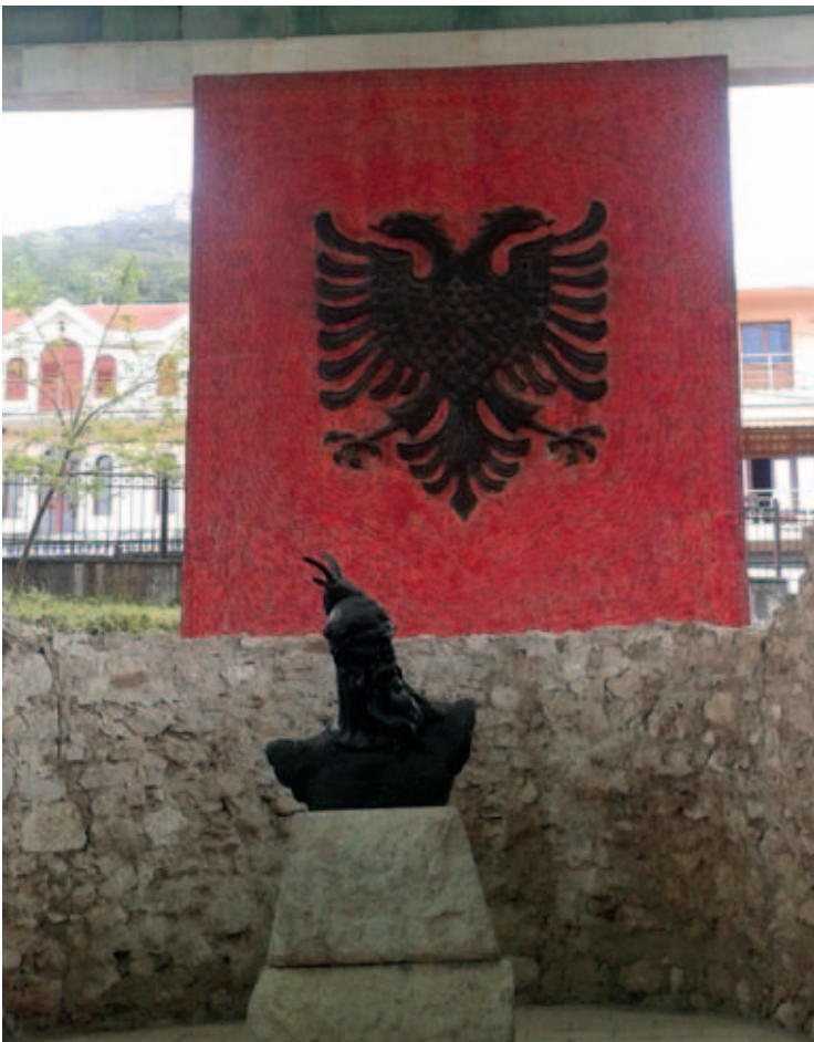
Monumento di Skanderbeg a Lezhë.

Vi ringraziamo di cuore per questa calorosa accoglienza in questa Sede e per aver preparato così bene il programma della nostra visita nella terra dei nostri Padri, sostenendo anche tutte le spese per il nostro soggiorno in Albania, segno di stima e di grande ed indimenticabile gentilezza. Quando verrete da noi a Lungro cercheremo di ricambiare questa vostra ospitalità. Voi membri di questa Associazione avete da anni compreso il valore ed il significato della nostra Arberia in Italia. Per ben tre volte (2006, 2010, 2013) siete venuti