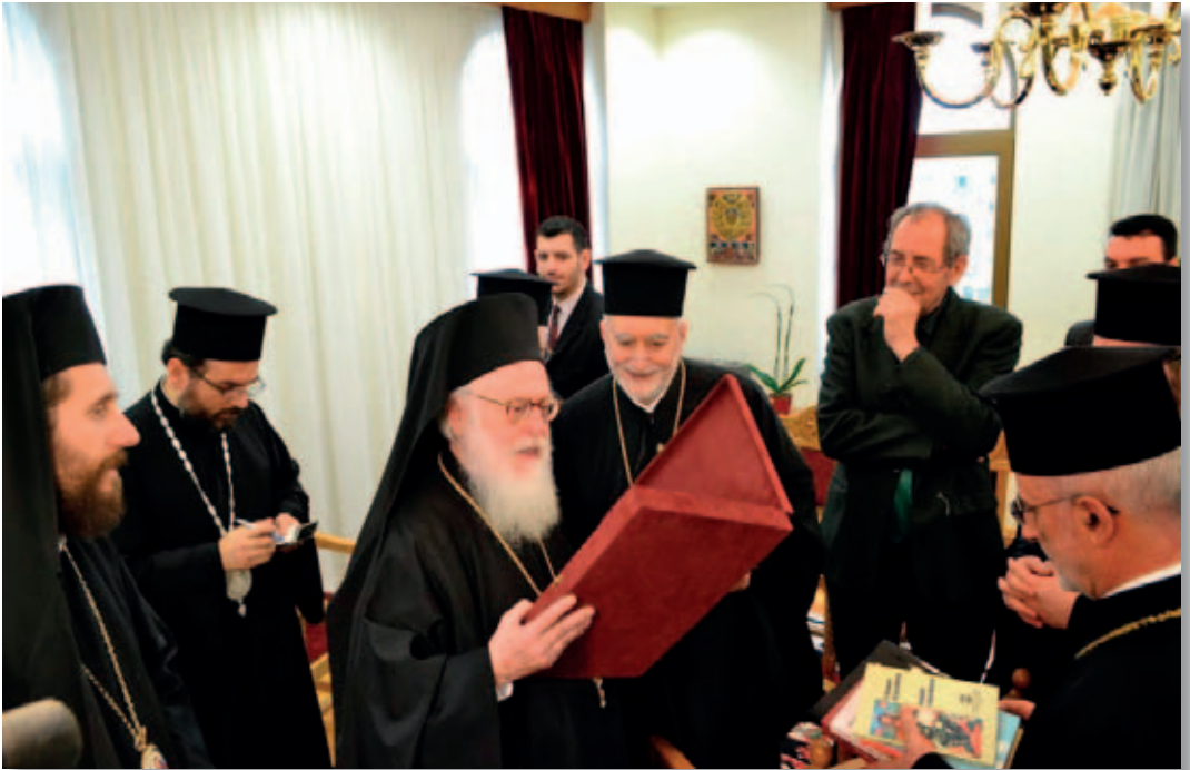
Tirana. Visita in episcopio a S. E. Mons. Anastas Janullatos, Arcivescovo Ortodosso di Tirana-Durazzo e Primate di tutta l’Albania.

7. Il Patriarca Ecumenico con queste poche parole ci ha illuminato l’inizio e l’origine della nostra storia come Chiesa Italo-