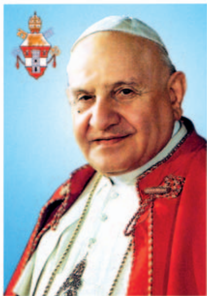
S. IOANNES XXIII (1881-1963)

Il Santo Padre Papa Francesco ha definito San Giovanni XXIII “ il Papa della docilità allo Spirito Santo ” e Giovanni Paolo II “ il Papa della famiglia ”.