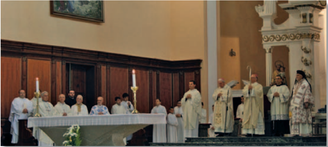
Scutari. Solenne pontificale in cattedrale.

per questa accoglienza e Le auguriamo di venire a visitare la nostra Eparchia.