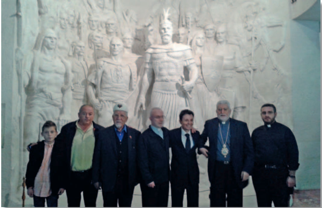
Kruja, Visita al museo nazionale “Giorgio Castriota Skanderbeg”.

Albania. I vostri ed i nostri contatti mirano a rendere più saldo questo patrimonio storico della nostra Nazione Albanese.