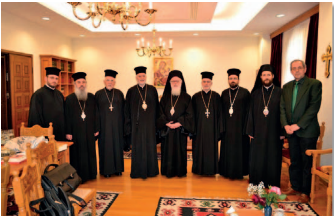
Tirana. Visita in episcopio a S. E. Mons. Anastas Janullatos, Arcivescovo Ortodosso di Tirana-Durazzo e Primate di tutta l'Albania.

“Oj e bukura More, si të le u më s'të pe, atje