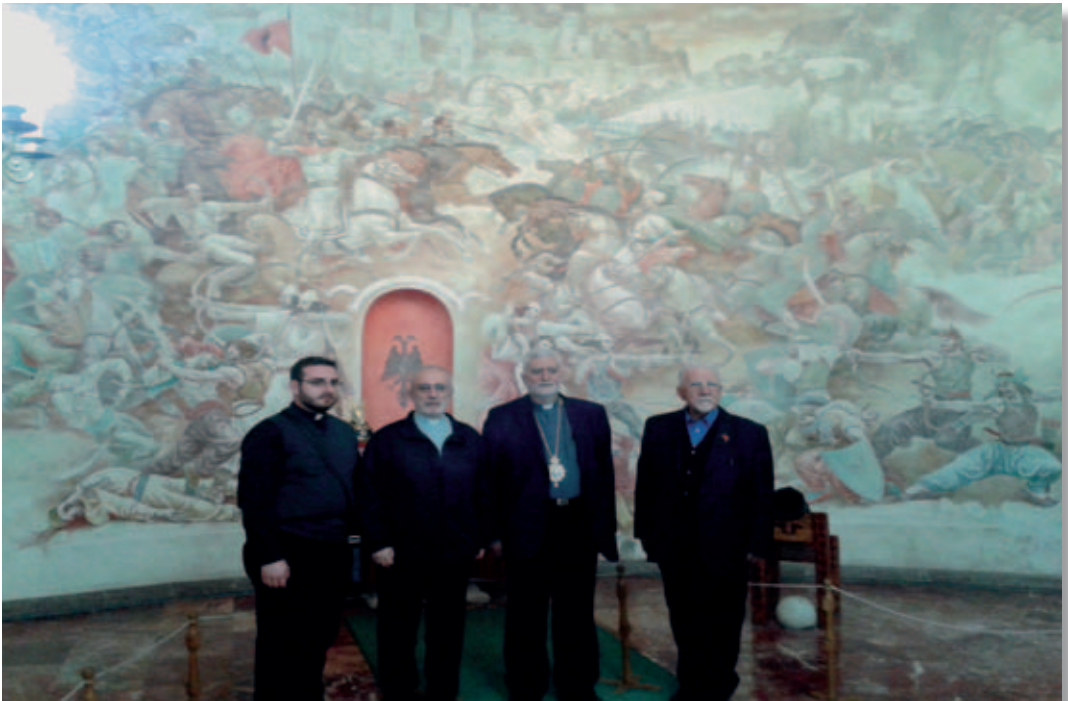
Kruja, Visita al museo nazionale “Giorgio Castriota Skanderbeg”.

* Protopresbitero dell'Eparchia di Lungro e Responsabile diocesano per i rapporti con l'estero. Vive a Frasinetto, ove dirige la Biblioteca di spiritualità bizantina e di cultura italo-greco-albanese.