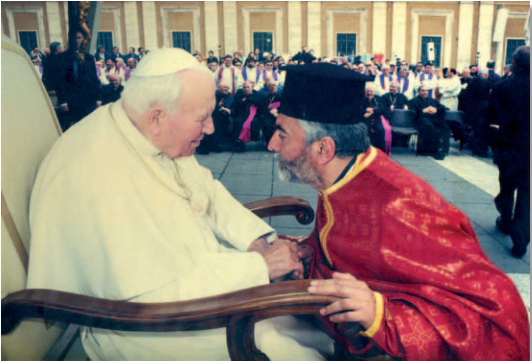
Roma. Pellegrinaggio delle Chiese di Calabria, Anno Santo 2000.

Oggetto di tali e tante preziose cure, gli Italo-Albanesi non tralasciano occasione per esprimere anche esteriormente la loro gratitudine e la loro sincera devozione al Santo Padre, alla Congregazione per le Chiese Orientali e a chi la rappresenta.