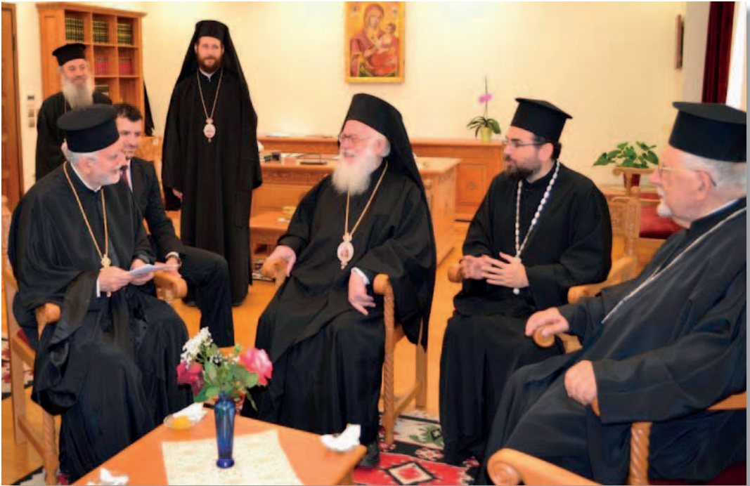
Tirana. Visita in episcopio a S. E. Mons. Anastas Janullatos, Arcivescovo Ortodosso di Tirana-Durazzo e Primate di tutta l'Albania.

5. Noi italo-albanesi siamo considerati come un ponte di pace tra popoli di credo, di lingua e di usanze diverse. Noi siamo fieri di essere italo-albanesi, perché con l'aiuto del Signore abbiamo mantenuto