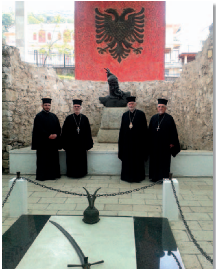
Visita al Monumento di Skanderbeg a Lezhë.

a Lezhë, ove c'è stato un casuale incontro con un gruppo di Kossovani, di appartenenza musulmana, invalidi di guerra, i quali nel sentire la provenienza dei visitatori e la loro parlata si sono fortemente commossi e hanno abbracciato gli stessi definendoli fratelli e veri custodi dei valori dell'antico popolo albanese. Altrettanto commovente la visita a Kruja e al Museo Nazionale "Giorgio Castriota Skanderbeg", ricco di storiche opere evocative. Ovunque,