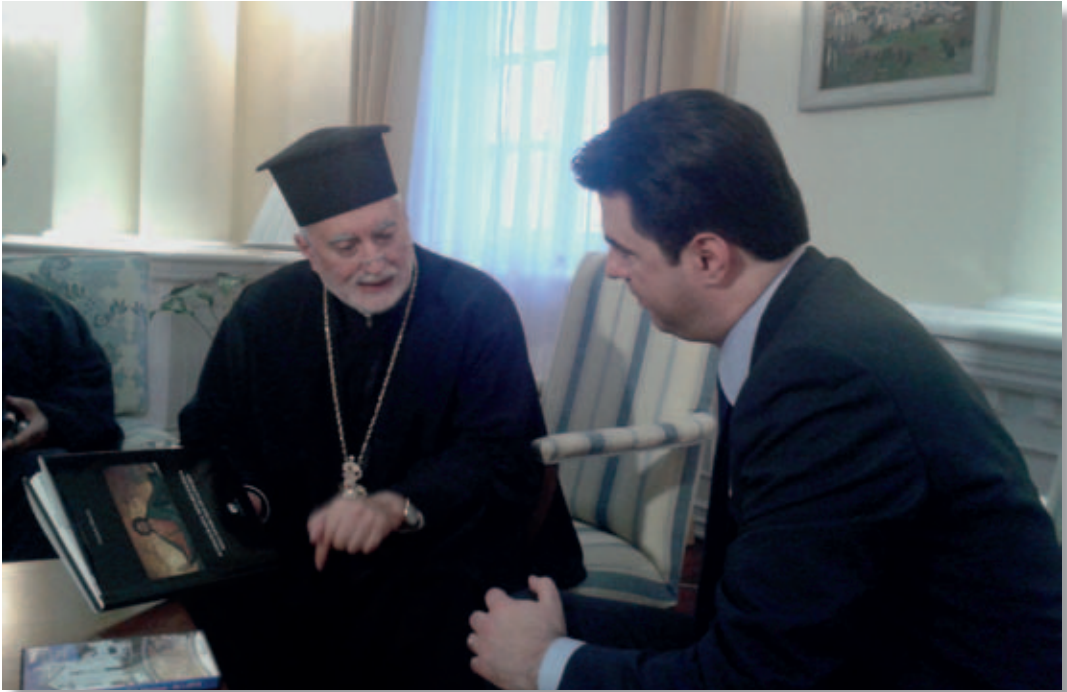
Il Vescovo di Lungro incontra il sindaco di Tirana

për shëjtërimin të Popullit tonë të dashur shqiptar. Ne presmi nga ana juaj viziten e dytë dhe këshut mund të shikoni më mirë si perparon edhe e vogla Arbëria jonë në Kalabri.