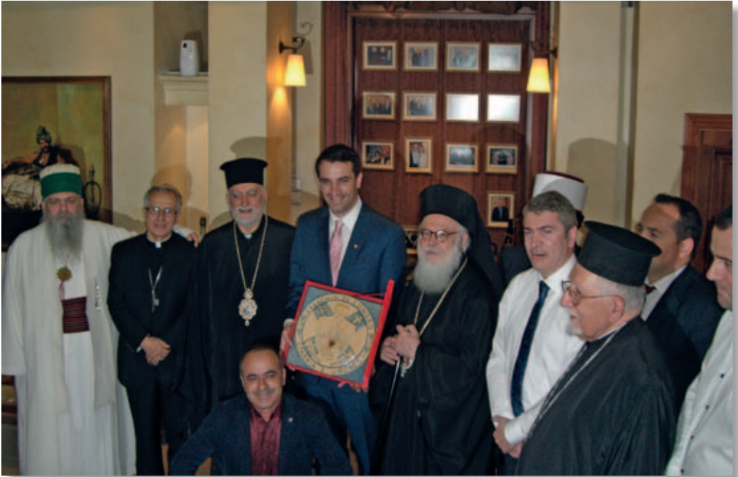
Tirana. Il Vescovo consegna copia dello stemma al Ministro Erion Veliaj