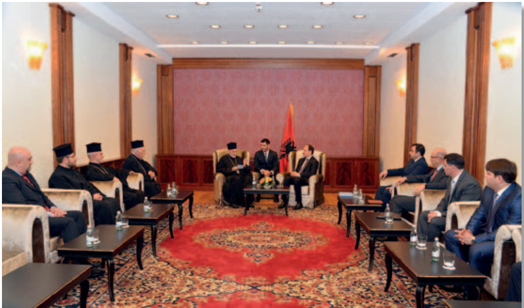
Tirana. Incontro con Buhar Nishani, Presidente della Repubblica d’Albania

Kjo veprimtari letrare të popullit arbëresh kishte këtë tri qëllime kryesore:1.Ruejtja e